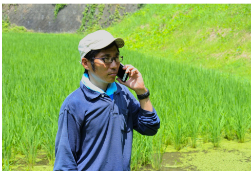
てるちゃんからかかってきた電話を取る様子