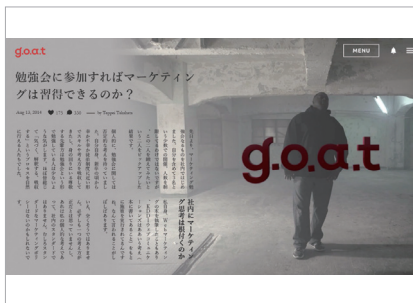
雑誌風レイアウト