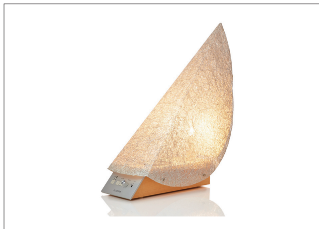
acarine 001 / 210,000円(税込)

ライティング&Bluetoothスピーカーシステム。ランプシェードは、着物や帯で使用される銀糸を用いて製作され、Bluetooth対応のスピーカーを内臓。音と光を一緒に楽しんでいただける商品。