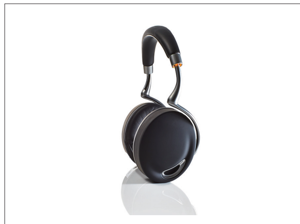
Parrot Zik / 39,900円(税込)

ライティング&Bluetoothスピーカーシステム。ランプシェードは、着物や帯で使用される銀糸を用いて製作され、Bluetooth対応のスピーカーを内臓。音と光を一緒に楽しんでいただける商品。