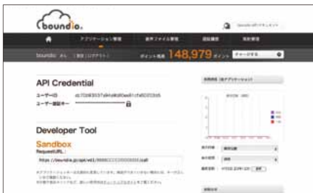
boundioユーザー管理画面